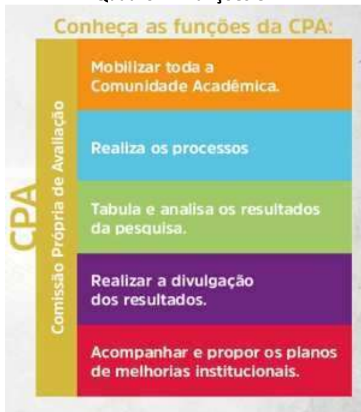
Quadro 4 – Funções CPA