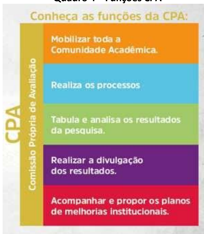
Quadro 4 – Funções CPA