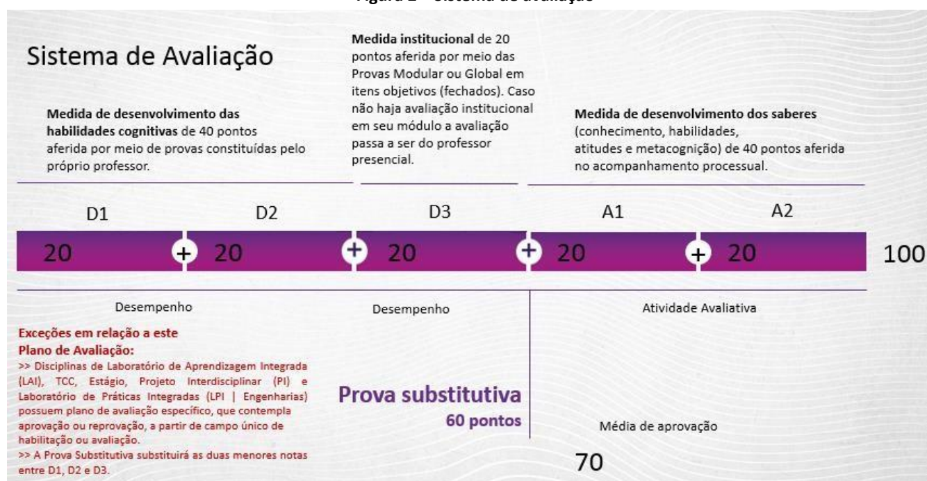
Figura 2 – Sistema de avaliação

O rendimento acadêmico dos alunos dos cursos de graduação deverá ser apurado atribuindo-se a eles 100 (cem) pontos cumulativos, através do sistema de avaliação ilustrado na imagem a seguir.