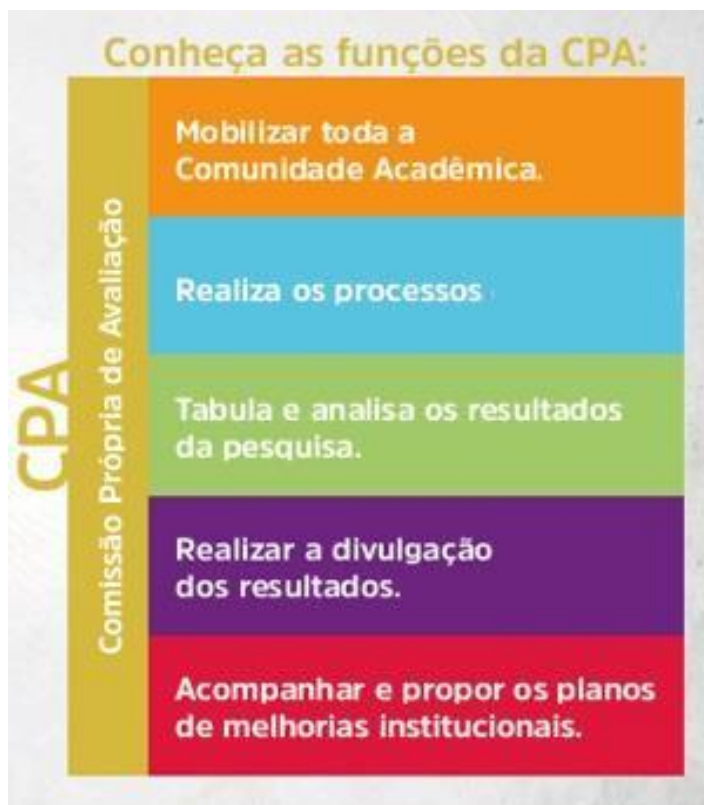
Figura 3 – Funções CPA