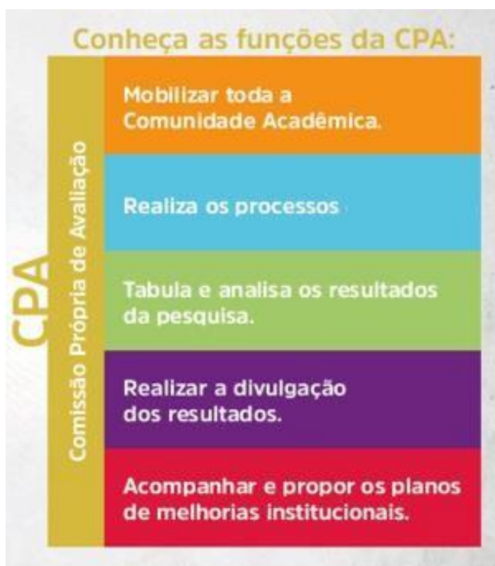
Figura 3 – Funções CPA