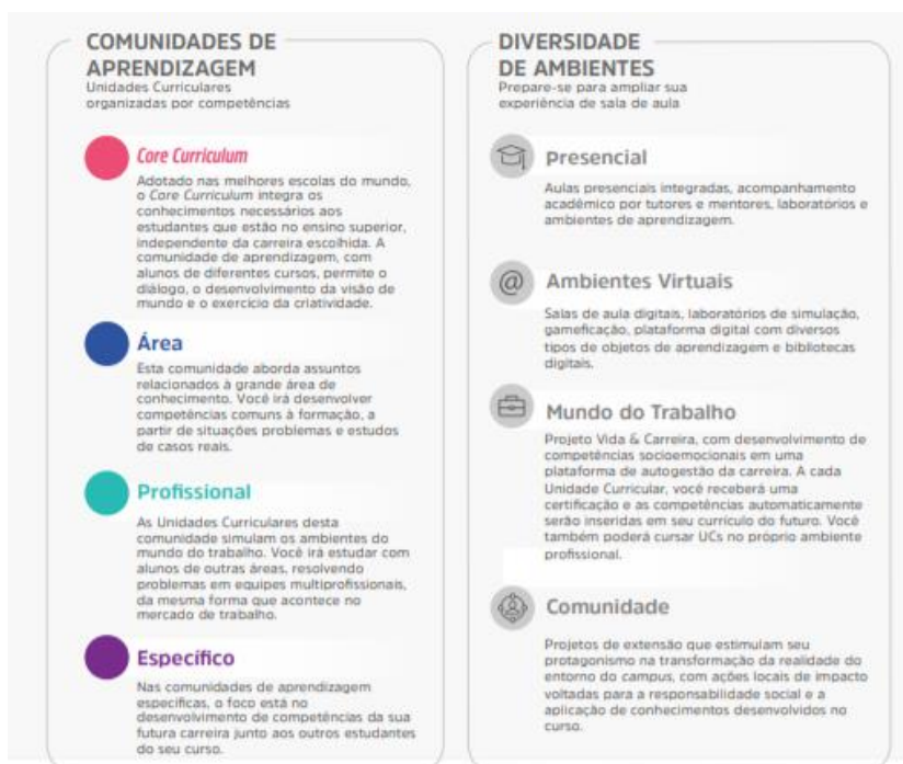
Figura 1 – Comunidades de aprendizagem e diversidade de ambientes

A flexibilidade do Currículo Integrado por Competências permite ao estudante transitar por diferentes comunidades de aprendizagem alinhadas aos seus respectivos eixos de formação. O percurso formativo é flexível, fluído, e ao final de cada unidade curricular o aluno atinge as competências de acordo com as metas de compreensão estudadas e vivenciadas ao longo do semestre.