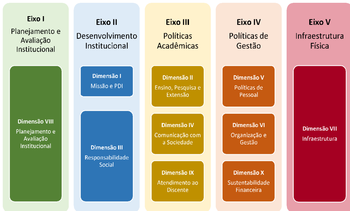
Figura 2 – Eixos e dimensões do SINAES